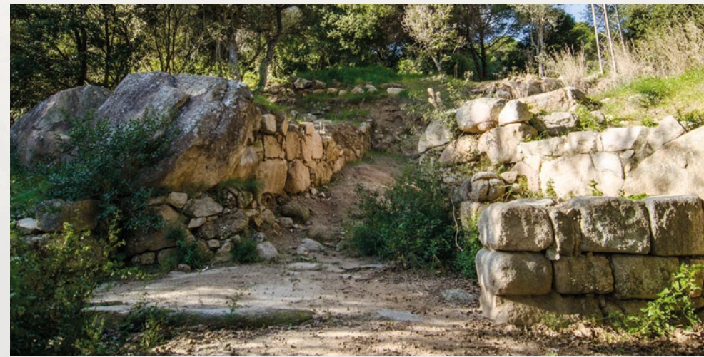
POBLAT IBER DE BURRIAC