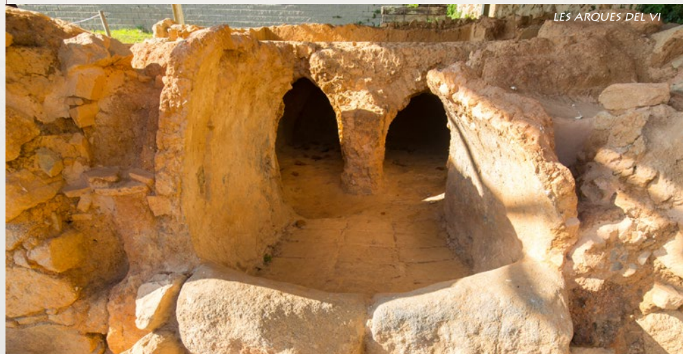
LES ARQUES DEL VI

Quan deixà el mar supervisà la construcció d'àmfores i la producció de vi local. Ara el gruix del negoci el fa son fill, ell es dedica a aconsellar sobre quins mercats és millor invertir. La seva experiència en tots els àmbits de vi i les seves interessants amistats de totes les ribes del Mediterrani el fan ser un coneixedor amb voluntat de trobar inversors que decideixin confiar en ell per guiar els seus sestercls!