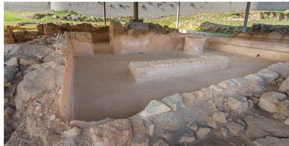
TERMES DE CA VARNAU