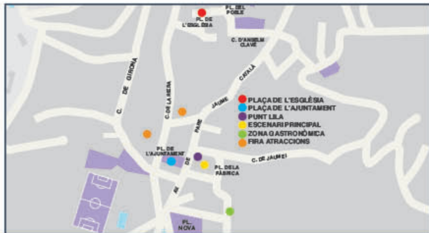
* Espais principals de la Festa Major.

El Punt Lila no només es configura com servei d'informació i atenció sinó també com un espai segur, on 2 professional i membres de l'entitat Espai Dona de Cabrera de Mar oferiran informació i assessorament per tal de treballar àmbits d'igualtat i de la no discriminació, un valor central que volem instaurar a la nostra Festa Major. Esperem que durant les nits de festa d'enguany no hi hagi cap incidència d'aquest tipus i que el Punt Lila serveixi com a difusió i mètode de pedagogia i prevenció.