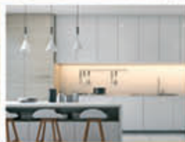
CUINES I ARMARIS