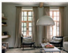
PORTES I VIDRIERES