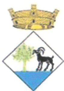
Ajuntament de Cabrera de Mar