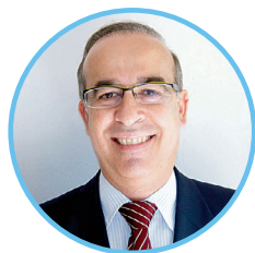
JORDI MIR I BOIX Alcalde de Cabrera de Mar